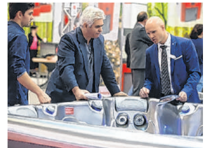
Entspannung im Bad

und speichern – eine lukrative Investition in das Eigenheim und eine lebenswerte Zukunft. Die innovativste Technik zum Anfassen, Auskünfte zu Förderungen sowie Stromvermarktungs- und Nutzungskonzepte gibt es auf der „Webuild Energiesparmesse“ Wels in der Trendwelt „Die Energiewende“ in den Hallen 19–21. „In Wels erfährt der Besucher alles zu den aktuellen Förderungen, Innovationen und Fortschritten in der Photovoltaik und vor allem der Stromspeicherung. Über allem steht der Megatrend der dezentralen Energiegewinnung, der die nächsten Jahrzehnte dominieren wird“, sagt „Webuild“-Projektleiter Erich Haudum.