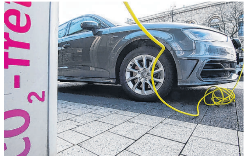
Ausreichend Lademöglichkeiten sind für E-Autos unerlässlich.

■ Ladeinfrastruktur für den mehrgeschoßigen Wohnbau: Ziel dieser Förderaktion ist, intelligente und