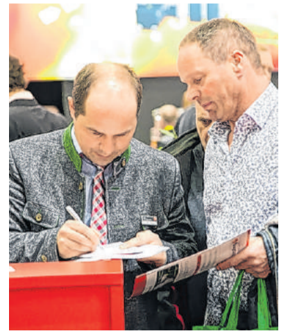
Beratung aus erster Hand