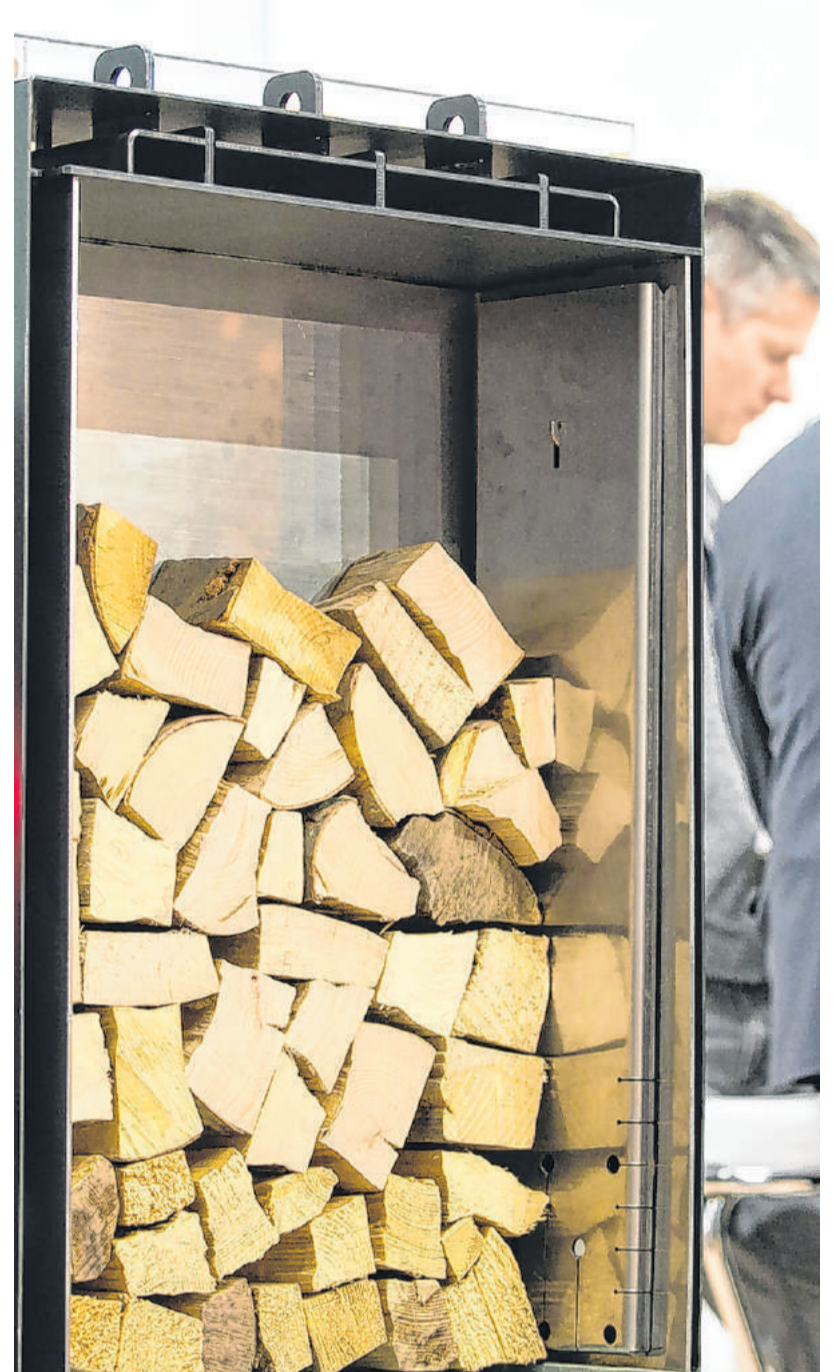
Holz genießt in jeder Form das Image eines klimaneutralen Brennstoffs.

Oberösterreichs Führungsrolle beim modernen Heizen mit Holz zeigt sich auch darin, dass die Europäische Pelletskonferenz, die vom OÖ Energie-sparverband am 4. und 5. März im Rahmen der World Sustainable Energy Days in Wels organisiert wird, die größte weltweite jährliche Pelletsveranstaltung ist. Jedes Jahr treffen sich mehr als 450 Teilnehmer aus mehr als 50 Ländern in Wels. Mehr als die Hälfte der Teilnehmer kommt von außerhalb des deutschsprachigen Raums.