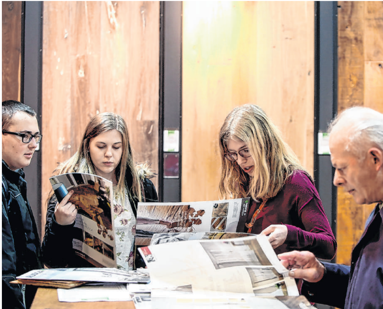
Von natürlichen Materialien geleitet können Messebesucher in Wels in Wohnwelten eintauchen.

Edel wirken die organischen Formen bei Lampen, Vasen und Möbel, die ebenfalls einen Hauch Retro-Flair in