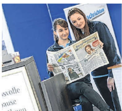
Zwei Stände der OÖN in Wels

HALLE 19 | ZUKUNFTSFORUM ENERGIE (MI - SO)