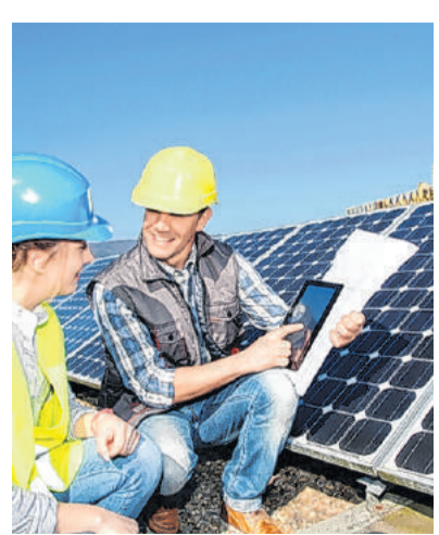
PV-Strom für Eigenbedarf

Photovoltaik ist mehr als großflächige Paneele auf Hausdächern. Für den Einzelnen bedeuten die Produktion und Speicherung von Strom aus Sonnenenergie Unabhängigkeit von zentralen Kraftwerken und die Möglichkeit, den Strom für den Eigenbedarf selbst zu erzeugen. Eine der größten Herausforderungen ist dabei die Verfügbarkeit der Energie. Denn wird Strom aus Wind- oder Solarenergie erzeugt, müssen Speicher leistungsschwache Zeiten ausgleichen. Heute können der Carport, der Gartenzaun und die Fassade zur Stromerzeugung durch Photovoltaik-Zellen genutzt werden. Das zeigt auf der Energiesparmesse der Gemeinschaftsstand des Bundesverbandes Photovoltaic Austria ebenso wie die neueste Stromspeichertechnologie. Darunter der weltweit erste vollständig modulare Stromspeicher und ein