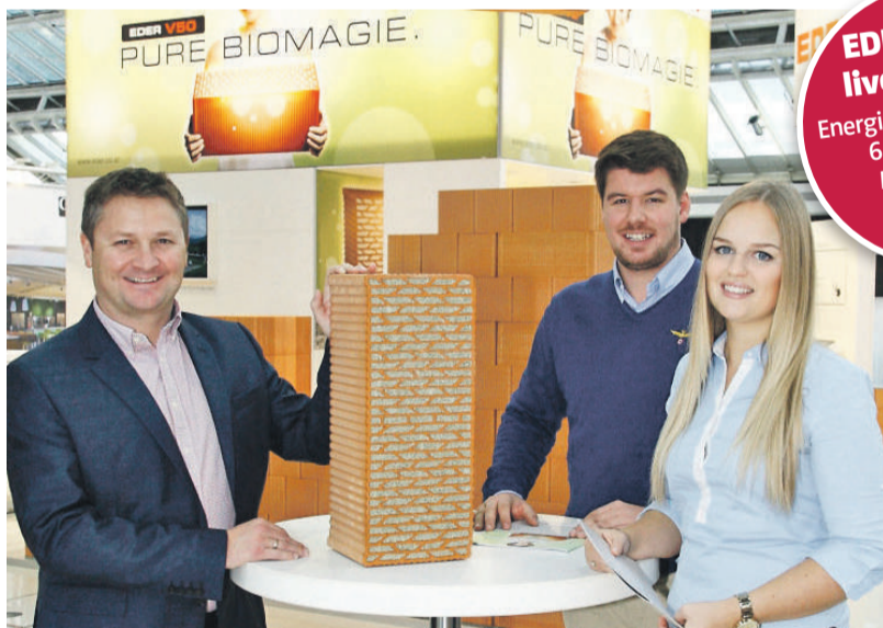
EDER auf der Messe: persönliche Beratung direkt vom Profi

Treffen Sie die EDER-Profis persönlich auf der Energiesparmesse Wels, Messezelt im Freigelände, Block B. www.eder.co.at