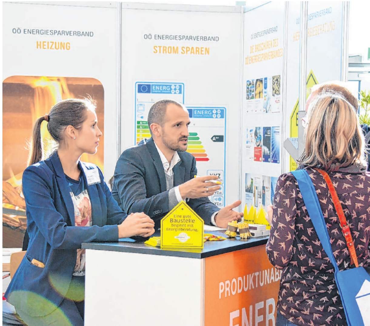
Experten des OÖ Energiesparverbandes beraten produktunabhängig über energiesparendes Bauen und Sanieren.

■ Sonderschau: E-Auto & Smart Home: Der Energiesparverband des Landes und die Messe Wels laden im Foyer der Halle 20 zur Sonderschau „E-Auto & Smart Home“ ein. Schwerpunkt der Sonderschau ist es zu zeigen, wie die E-Mobilität und das Haus bestmöglich aufeinander abgestimmt werden können. Ausgestellt werden verschiedene Typen von Ladestationen,