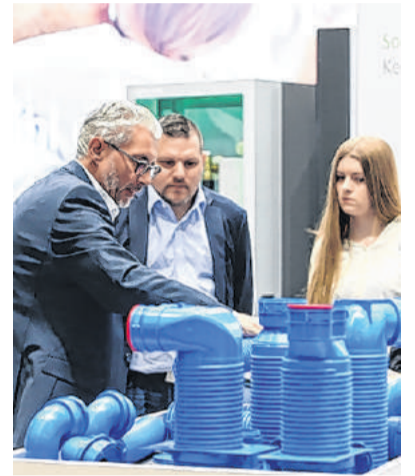
Innovationen zum Anfassen