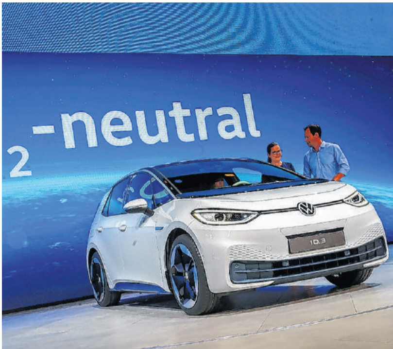
E-Mobilität ist das Thema Nr. 1 in der Fahrzeugindustrie.