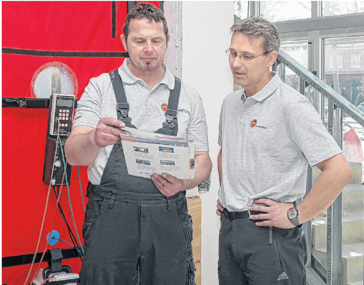
Erstellt wird die Energie- und Klimabilanz vom Oö. Energiesparverband bei einer betrieblichen Energieberatung.

Das eigens vom OÖ Energiesparverband entwickelte Tool basiert auf jenen Daten, die im Zuge des Energieeffizienz-Gesetzes des Bundes und von Audit-Berichten ohnehin in den Unternehmen vorliegen. „Daraus wird in der Folge ein grafisch aufbereiteter Überblick über die CO 2 -Emissionen gegeben, aufgegliedert in Gebäude, Prozess und Transport. Aber nicht nur der Ist-Zustand wird dargestellt, sondern auch bereits geplante Effizienz-Maßnahmen werden er-