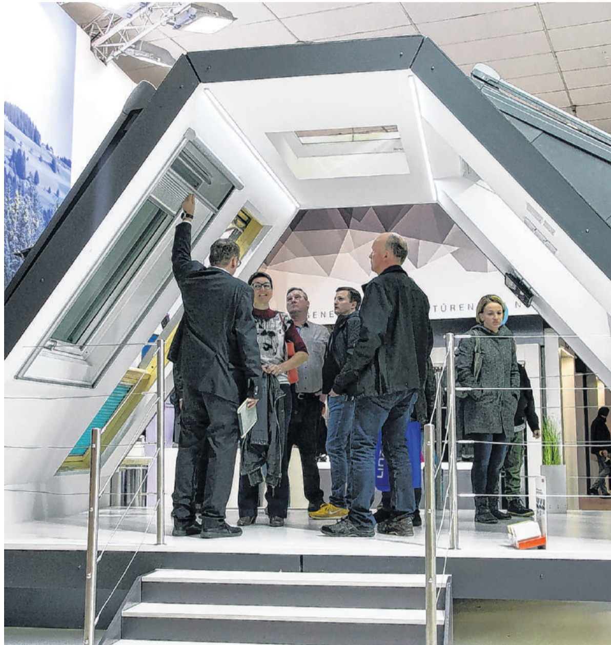
Der Besuch bei der Energiesparmesse hilft beim Vorhaben, das Haus von morgen zu bauen.

■ Trendwelt: Die Energiewende: Die Zukunft der Energiesysteme und