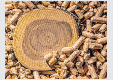
Pellets im Fokus

Nähere Informationen unter: www.energiesparverband.at