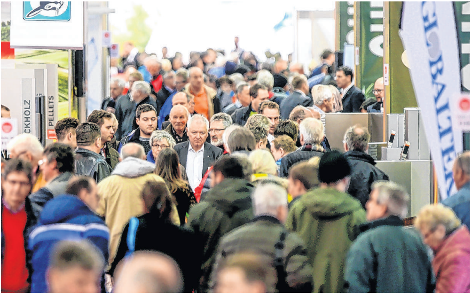
Die Energiesparmesse ist für Hausbauer und Sanierer die erste Anlaufstelle, um sich über Neuigkeiten in den Branchen Bau, Bad und Energie zu informieren. (Weihbold)