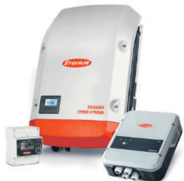
Das Herzstück der Fronius Speicherwelt: Fronius Symo Hybrid mit Fronius Smart Meter und der Wärmelösung Fronius Ohmpilot

Der vielseitige Fronius Symo GEN24 Plus Hybridwechselrichter ergänzt demnächst das Fronius-Portfolio. Ob Speicher, Notstrom, Wärme oder E-Mobilität, der Fronius GEN24 Plus bietet eine einzigartige Lösungsvielfalt und wird so zum Meilenstein der Energiewende im Eigenheim.