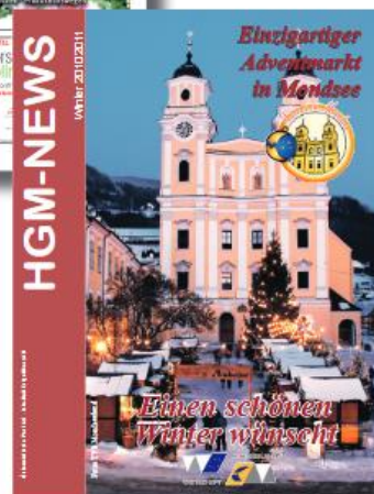
Zeitungsformat: 208 x 270 mm abfallend, dreiseitig beschnitten