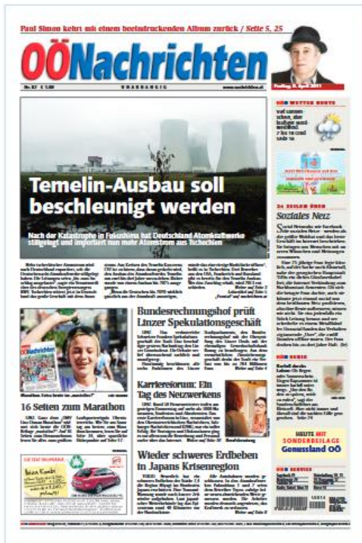
Zeitungsformat: 300 x 450 mm

Dokument- bzw. PDF-Größe: 280 x 402 mm Anschnitt und Infobereich: 4mm Abschnitt Zeitungsformat beschnitten: 280 x 402 mm