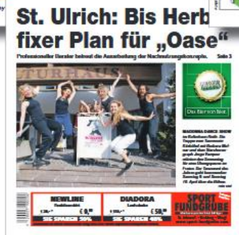
Zeitungsformat: 210 x 292 mm nicht abfallend