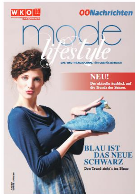
Zeitungsformat: 280 x 402 mm dreiseitig beschnitten