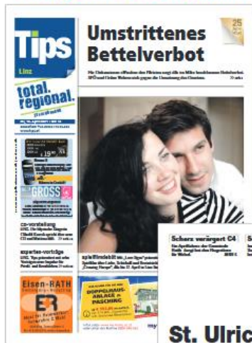
Zeitungsformat: 225 x 300 mm